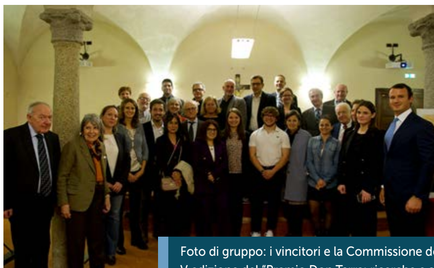
Foto di gruppo: i vincitori e la Commissione della V edizione del "Premio Don Tarra: ricerche e studi sulla sordità" con i vincitori delle Borse di Studio studenti.